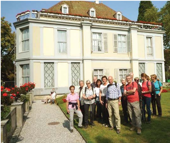
Bei seiner Herbstwanderung besichtigte der Skiclub Engen die Schlösser Arenenberg, Salenstein, Eugensberg, Sandegg und Louisenberg.