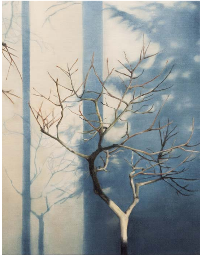
Anna Krammig, ohne Titel (Baum), 2015.

Die Veranstaltung ist kostenfrei. Im Anschluss besteht Gelegenheit, sich bei einem kleinen Umtrunk über die neuen Erkenntnisse auszutauschen.