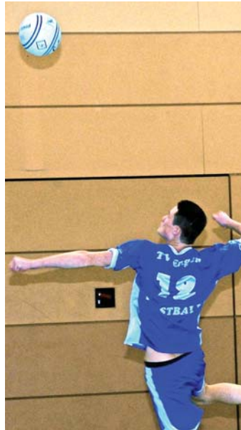
Zum 46. Internationalen Hallen-Faustballturnier lädt die Faustball-Abteilung des TV Engen am kommenden Sonntag, 8. Oktober, ab 9 Uhr in die Großsporthalle in Engen ein.